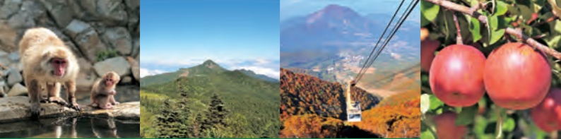
yamanouchi cycling map